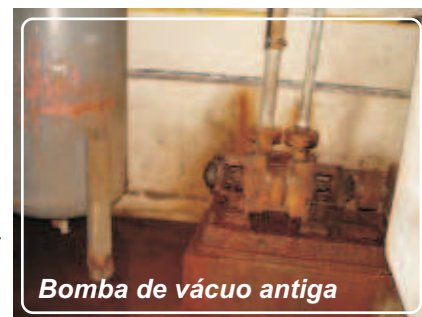
Bomba de vácuo antiga