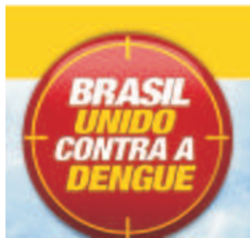
Campanha do Ministério da Saúde